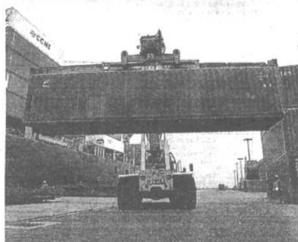
La semana pasada, ya el MTC adelantó que iban a darse cambios.

Esto se refiere al documento "Manifiesto de Carga" (en el cual se detalla la relación de la mercancía que constituye carga en la nave que la transporta, y expresa los datos comerciales de las mercancías). Se modifica el procedimiento, señalando