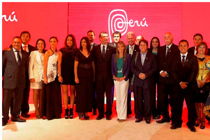
ExpoPerú Chile 2013 tuvo foro de comercio e inversiones, la exhibición de productos de exportación y de destinos turísticos, promoción de la moda y la gastronomía peruanas.

Durante el lanzamiento de la ExpoPerú Chile 2013, el ministro refirió que esa proyección es superior a la cifra obtenida en una versión similar de ExpoPerú realizada en el año 2009.