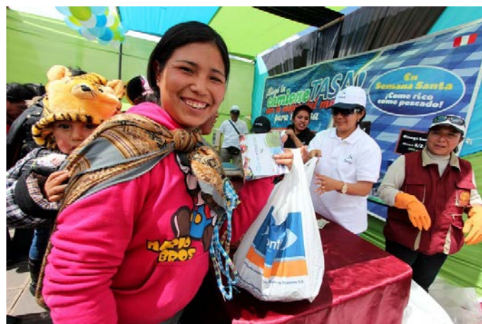
Campaña CamioneTASA benefició a más de 10 mil personas y ofertó 12 toneladas de jurel en Abancay, Andahuaylas, Cusco y Juliaca a S/. 2 el kilo.

10 mil personas fueron beneficiadas con la venta, a precios muy económicos, de 12 toneladas de jurel y 2000 bolsas de hamburguesa de anchoveta "Omega Burger" en las ciudades de Abancay, Andahuaylas, Cusco y Juliaca gracias a la empresa TASA y a los municipios de cada ciudad, llevando a la mesa popular un producto altamente nutritivo, cuyo costo promocional fue de S/. 2.00 el kilo.