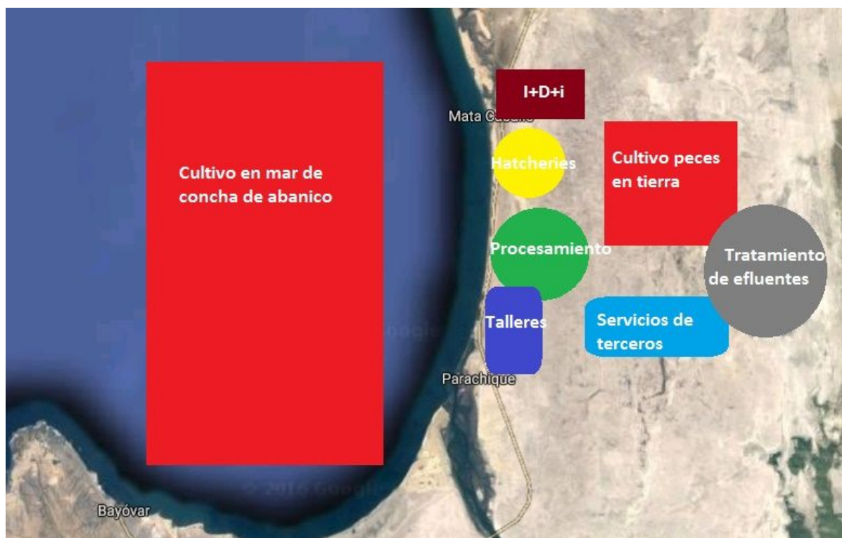
Fig. 02. Concepto del Parque Industrial de Acuicultura Bahía Sechura.

El PIA Sechura reunirá a productores, procesadores, la academia (universidades, institutos de investigación), gobierno en un “ecosistema” que facilitará la coordinación entre las diferentes instancias permitiendo la innovación y mejora continua de la actividad acuícola en la bahía de Sechura.