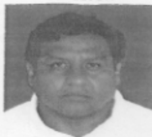
DIRECTOR DEFENSA MARINA